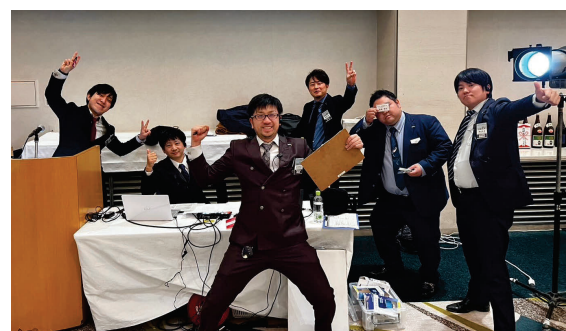
2月例会担当 会員交流委員会の皆さん