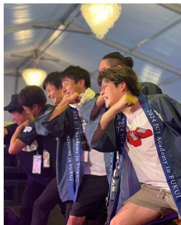
2024 JCI ASPAC アンコール大会の写真