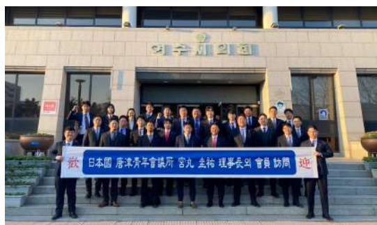
2024年度 麗水会議の写真

例年、唐津JCと麗水JCでお互いの地を行き来しながら麗水交流事業を重ね、両LOMは50年以上の友好交流を続けてきました。そこで今回は麗水の地にて開催します。みんなと新しいバージョンを作り、麗水の地に行ってきます！